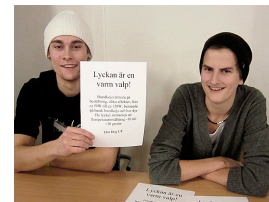
Hot Dog UF