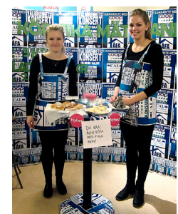
Välgörenhetskonsert UF - vann Bästa monter!