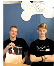
A&D hundkojor UF