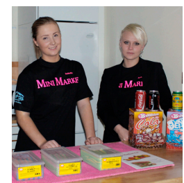
Mini Market UF