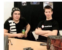
JL Svets och maskin UF